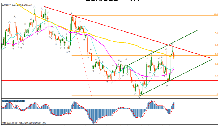
EUR/USD — H4

Dupa o perioada lunga de depreciere ale monedei europene in fata dolarului american, pretul a inceput o perioada corectiva definita prin formarea unor fractali in crestere pe zona de maxime. Trecerea pretului deasupra mediilor mobile de 50 respectiv de 200 de perioade, reprezinta principalul semnal ce confirma unda ascendenta.