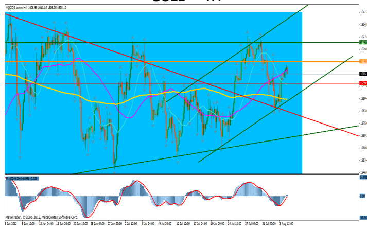
GOLD — H4

Dupa o tendinta puternic negativa, urmata de una de corectie, aurul a intrat intr-o zona de consolidare cu o volatilitate ridicata in ambele directii, ca reactie la stirile negative din mediul economic global. Formatiunea triunghi din care a iesit pretul prin depasirea si retestarea nivelului superior, introduce ipoteza formarii unei unde de crestere.