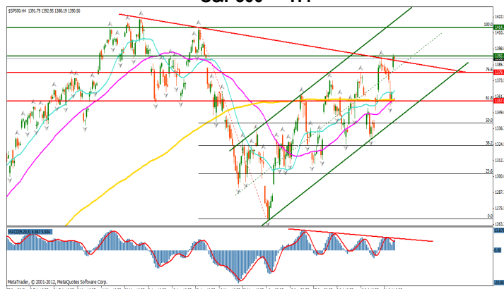
S&P500 — H4

Piata de capital americana se afla intr-o tendinta usor ascendenta, definita de depasirea liniei de trend descendent si a nivelului de retragere de 76.6% a trendului descendent anterior, 1414-1267. Atat timp cat pretul ramane deasupra nivelului median al canalului de regresie ascendent, tendinta pozitiva va continua si va avea ca targeturi principale nivelurile de maxim anterioare, 1414 respectiv 1421.