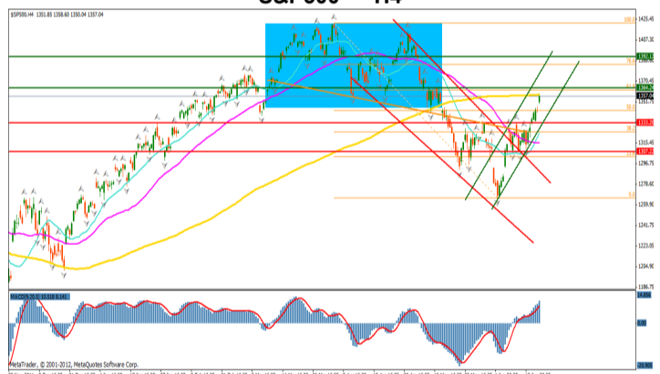
S&P500 — H4

Pretul si-a reluat tendinta de crestere pe termen scurt, depasind astfel nivelul mediilor mobile de 20 respectiv 50 de perioade, reusind sa treaca si peste nivelul retragerii de 50% a trendului descendent anterior, 1421—1266. Un potential target al pretului conform formatiunii "head & shoulders reverse" se afla la nivelul 1400. Acest scenariu va fi confirmat daca pretul reuseste sa depaseasca nivelul mediei mobile de 200 de perioade precum si nivelul retragerii de 61.8% a aceluiasi trend descendent. Trigerul pentru initierea unei tranzactii de vanzare, in cazul in care trendul descendent se reia, il reprezinta inchiderea sub nivelul inferior al canalului de regresie ascendent.