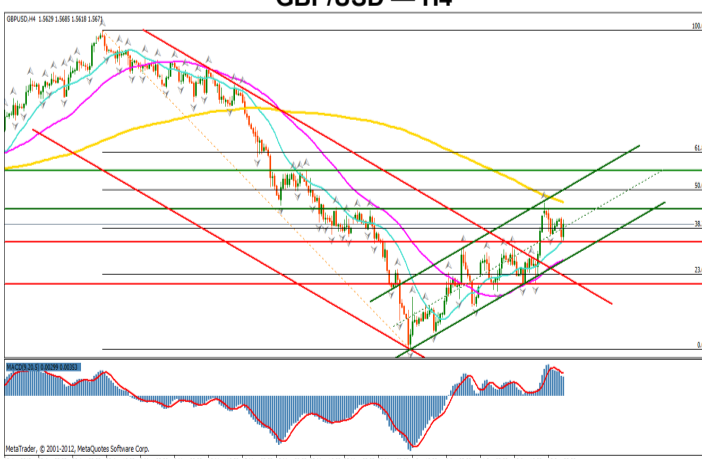
GBP/USD — H4

lesirea din canalul de regresie descendent si evolutia corectiva din ultimele zile au determinat definirea unei unde ascendente corective. Limitele canalului de regresie ascendent reprezinta importante puncte de inflexiune avand in vedere evolutia anterioara a pretului. Zona curpinsa intre nivelul mediei mobile de 50 de perioade si cea de 200 de perioade va putea fi o zona de consolidare, inainte ca pretul sa defineasca o tendinta. Stabilizarea acestuia deasupra nivelului median al canalului ascendent precum si depasirea mediei mobile de 200 de perioade va confirma continuarea tendintei corective pe care o are pretul. Targetul pentru acest scenariu va fi la nivelul retragerii de 61.8% a trendului descendent anterior, 1.6297—1.5267. In cazul strapungerii nivelului inferior al canalului de regresie ascendent, precum si in cazul inchiderii sub cel de-al doilea suport, 1.5477 vom anula scenariul ascendent si vom introduce ipoteza reluarii tendintei de scadere.