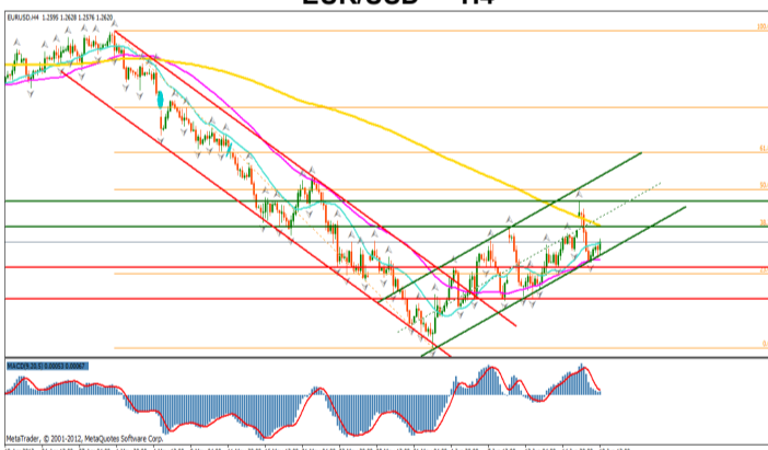
EUR/USD — H4

Dupa o luna cu depreciere constante ale monedei europene in fata dolarului american, aceasta a inceput saptamana intr-o tenta optimista, ca reactie la castigarea alegerilor parlamentare din Grecia de catre partidul Noua Democratie, cel care doreste o continuare a acordului cu FMI si BCE. Pretul s-a incadrat pe un canal ascendent corectiv reusind sa formeze atat maxime cat si minime in crestere. Nivelul median al canalului de regresie odata depasit reprezinta principalul trigger ce va confirma continuarea tendintei de crestere a pretului. Media mobila de 200 de perioade va confirma acest scenariu odata ce pretul va reusi sa inchida peste nivelul acesteia. Retragerea de 38.2% respectiv cea de 50% a trendului descendent anterior 1.3282—1.2288, reprezinta importante puncte de confluenta.