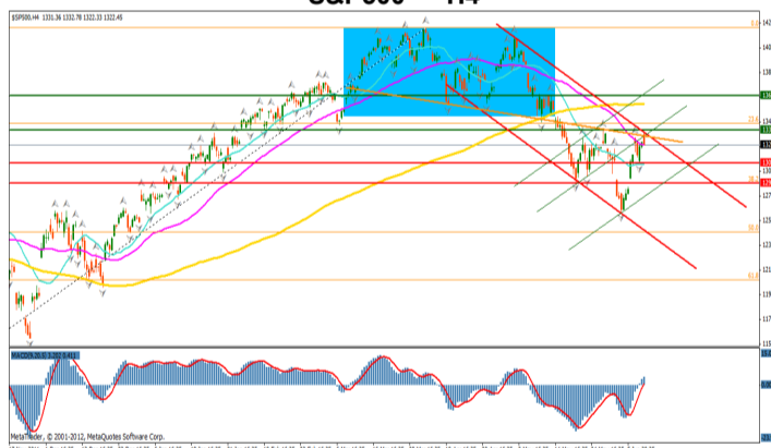
S&P500 — H4

Pretul si-a reluat tendinta de crestere pe termen scurt, depasind astfel nivelul mediei mobile de 20 de perioade, reusind sa treaca si peste nivelul retragerii de 38.2% a trendului ascendent anterior. Targetul conform formatiunii "head & shoulders" a fost atins la nivelul 1280, pretul reluandu-si unda de crestere, avand in vedere importanta ca suport a nivelului de retragere de 50% a trendului 1075–1421. Trigerul pentru initierea unei tranzactii de vanzare, in cazul in care trendul corectiv continua, il reprezinta inchiderea sub primul nivel de suport, 1265. Depasirea nivelului superior al canalului de regresie descendent poate fi considerat semnalul principal ce confirma reluarea trendului pozitiv.