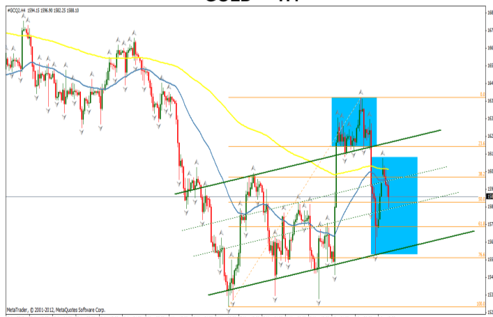
GOLD — H4

Dupa o tendinta puternic negativa, urmata de una de corectie, aurul a intrat intr-o zona de consolidare cu o volatilitate ridicata, ca reactie la stirile negative din mediul economic global. Evidentierea celor doua formatiuni de consolidare, cu volatilitati diferite ne introduce ipoteza continuarii incertitudinii pe pietele financiare. Trecerea sub nivelul mediei mobile de 50, respectiv, 200 de perioade precum si integrarea in zona mediana a canalului de regresie ascendent confirma tendinta laterala pe care o urmeaza pretul. Pragul 1700 daca va fi depasit va reprezenta trigerul inversarii de trend. Depasirea nivelului inferior al canalului de regresie ascendent va reprezenta trigerul pentru continuarea unei negative ce are ca target principal nivelul minimului local anterior. Pragul psihologic 1500 reprezinta un principal nivel de inflexiune, in cazul in care pretul va reusi sa inchida sub nivelul 1600.