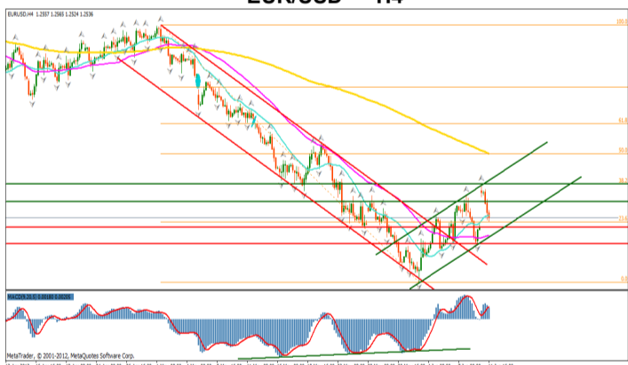
EUR/USD — H4

Dupa strapungerea si inchiderea peste nivelul superior al canalului de regresie descendent pretul s-a incadrat pe o tendinta ascendenta corectiva. Formarea fractalilor in crestere atata pe zona de maxime cat si pe cea de minime, cat si depasirea celor 2 medii mobile rapide, de 20, respectiv, 50 de perioade ofera imaginea continuarii tendintei pozitive pe termen mediu. Gap-ul pozitiv format la deschiderea pietei asiatice confirma o posibila revenire a monedei europene in fata dolarului american, dupa ce acesta va fi acoperit. Limitele canalului de regresie ascendent reprezinta importante puncte de inflexiune. Range-ul format intre nivelul psihologic 1.2500 si retragerea de 38.2% a trendului 1.3282 – 1.2288 reprezinta o zona de consolidare in care pretul ar putea evolua in urmatoarele zile.