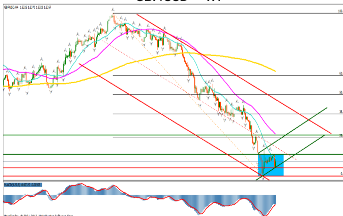
GBP/USD — H4

Pe termen lung, pretul se afla pe un trend puternic descendent, dupa ce acesta nu a reusit sa formeze fractali in crestere pe zona de maxime. Evolutia de la inceputul acestei saptamani este similara cu cea a saptamanii anterioare, cand pretul a avut o evolutie laterala, pana cand acesta a depasit nivelul inferior continuandu-si tendinta de scadere. Un scenariu asemanator se poate intampla daca nivelul inferior al zonei de range, 1.5266 – 1.5401, va fi depasit. Confirmarea continuarii scenariului de scadere va veni odata cu inchiderea sub nivelul psihologic 1.5300, avand un potential target nivel 1.5200. Tendinta laterala formata in ultimele zile creeaza ipoteza unei evolutii de consolidare viitoare dupa ce in ultima luna, dolarul a castigat aproximativ 5% in fata lirei sterline. Depasirea nivelului median al canalului de regresie descendent, precum si formarea unui nou fractal in crestere, reprezinta cateva semnale ce prefigureaza formarea unei unde corective ascendente.