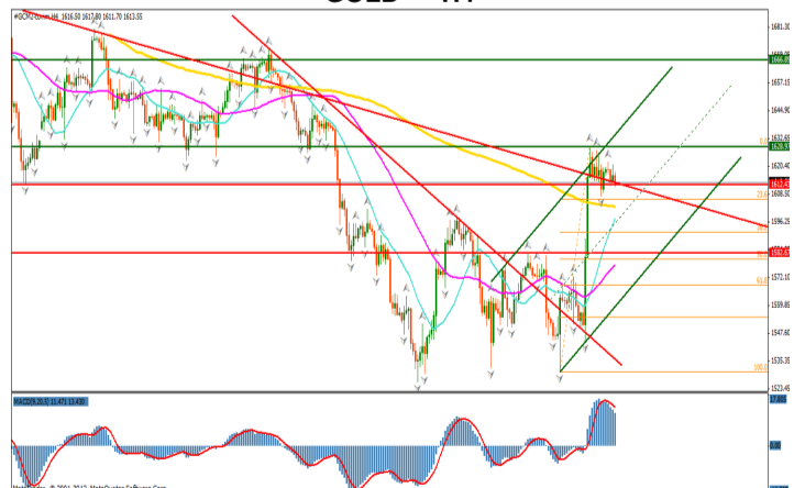
GOLD — H4

Dupa o tendinta puternic negativa, urmata de una de consolidare, aurul a intrat pe o unda puternic ascendenta, ca reactie la stirile negative din mediul economic global, retestand nivelul psihologic 1600. Evidentierea unei formatiuni de tip fanion ofera imaginea unei evolutii laterale pentru urmatoarea perioada. Trecerea peste nivelul mediei mobile de 200 de perioade precum si peste nivelul liniei de trend descendent al graficului zilnic, reprezinta semnale de reluare a tendintei crescatoare. Pragul 1700 daca va fi depasit va reprezenta trigerul inversarii de trend. Depasirea nivelului median al canalului de regresie ascendent va reprezenta trigerul pentru continuarea unei negative ce are ca target principal nivelul retragerii de 50% a trendului 1530–1629. Pragul psihologic 1500 reprezinta un principal nivel de inflexiune, in cazul in care pretul va reusi sa inchida sub nivelul 1600.