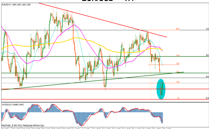
EUR/USD - H4

Deschiderea cu un gap negativ destul de mare a sesiunii asiatice a acestor saptamani reprezinta un semnal puternic de intrare in piata a vanzatorilor.