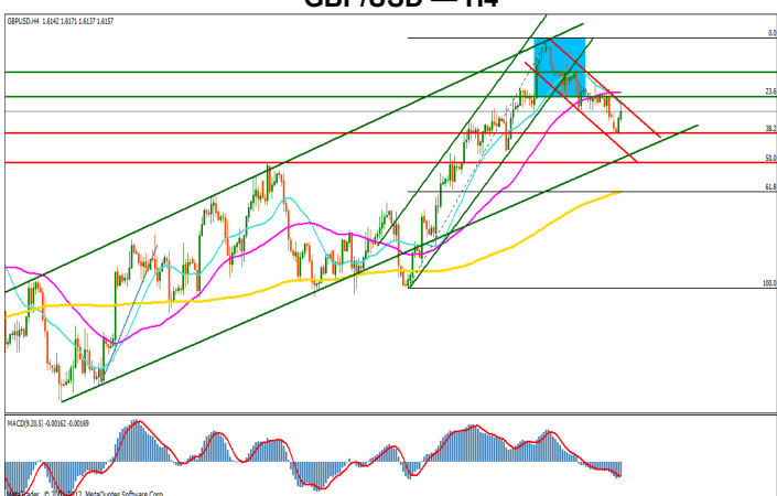
GBP/USD - H4

Pretul ramane pe un trend principal crescator, chiar daca evolutia ultimelor zile a adus usoare corectii. Canalul de trend descendent ramane unul de referinta pe unda corectiva.