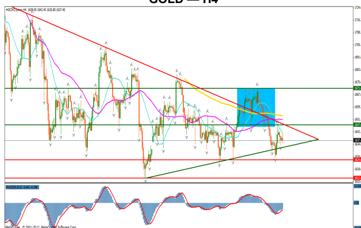
GOLD - H4

Pretul se afla pe o tendinta neutra, cu evolutii laterale, corelandu-se astfel cu evolutia pietei de capital. Pe termen lung evolutia este una descendenta.