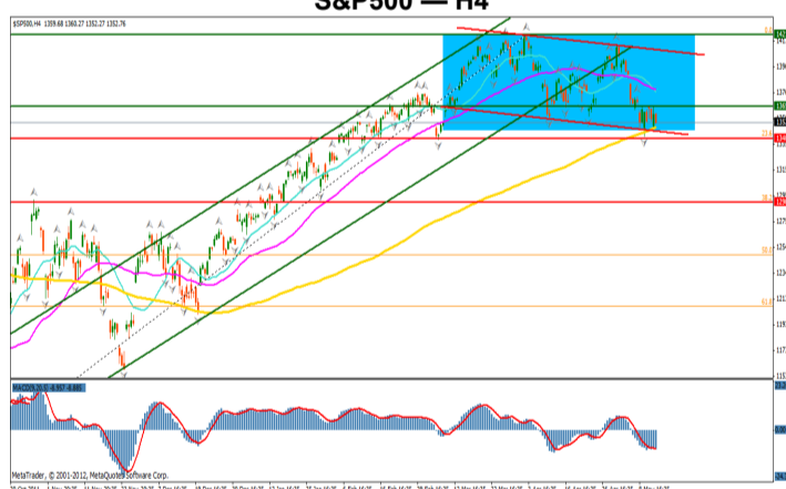
S&P500 — H4

Indicele de referinta al pietei de capital americane se mentine intr-o zona usor descendenta dupa ce a avut cateva zile de consolidare. Evolutia negativa a sfarsitului de saptamana vine ca reactie a discursului mai putin optimist despre nivelele somajului si inflatiei, al presedintelui FED, Ben Bernanke. Pretul a format un "double top", formatiune ce va fi confirmata in cazul in care acesta va reusi sa inchida ziua sub nivelul 1340. Targetul pentru acest scenariu se afla cel putin la nivelul 1250. In caz contrar, o mentinere in interiorul canalului descendent, poate duce la o evolutie de consolidare in urmatoarea perioada. Reluarea tendintei de crestere va fi confirmata odata cu trecerea peste nivelul 1410.