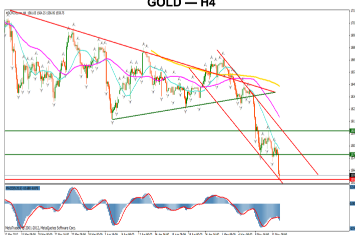
GOLD — H4

Pretul se afla pe o tendinta puternic negativa, dupa ce a iesit din interiorul triunghiului descendent, depasind totodata nivelul psihologic 1600. Departarea de cele 3 medii mobile, de 20, 50 si, respectiv, 200 de perioade, precum si divergenta dintre graficul pretului si indicatorul MACD, pot reprezenta semnale pentru formarea unei unde corective ascendente. Pe termen lung evolutia este una descendenta, limitele canalului in care evolueaza pretul reprezentand importante puncte de inflexiune. Un prim semnal de reluare a tendintei de crestere il va reprezenta depasirea nivelului celei de-a doua rezistente de astazi, 1.601, precum si a nivelului superior al canalului descendent. Targetul pentru scenariul negativ este dat de urmatorul nivel psihologic, 1500.