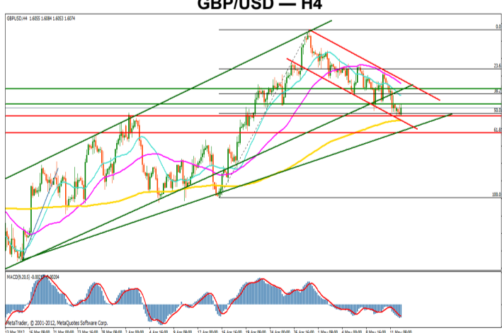
GBP/USD — H4

Pretul ramane pe un trend principal crescator, chiar daca evolutia ultimelor zile a determinat formarea unor unde corective. Iesirea din interiorul canalului de trend principal reprezinta un semnal important de continuare a undei de scadere. Nivelul retragerii de 50% a trendului 1.5818 — 1.6297 reprezinta un prim nivel de suport important, care odata depasit ar putea introduce ipoteza intrarii pe un trend descendent. Limita principala a trendului ascendent reprezinta targetul principal pentru unda descendentă. Principale puncte de inflexiune pe trendul descendent se afla in jurul pragurilor 1.6050 si 1.6003, cel din urma reprezentand retragerea de 61.8% a trendului 1.5818 — 1.6297. Ipoteza reluării tendintei de crestere poate fi introdusa odata cu depasirea limitei superioare a canalului corectiv. Ca niveluri de rezistenta avem in jurul valorilor 1.6084, respectiv, 1.6128.